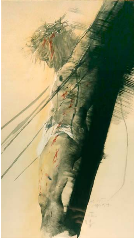
Milivoj Husák: Hoc est corpus meum , 1987