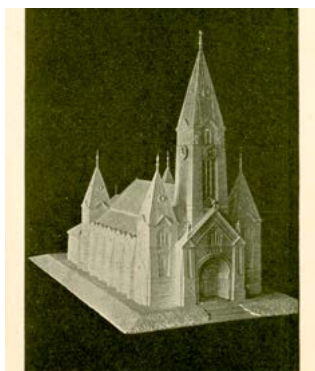
Chrám Páně Nejev. Srdce Ježíšova v Husovicích prosi o dárek

Pohlednice z roku 1906 s modelem plánovaného kostela a prosbou o příspěvek na jeho výstavbu