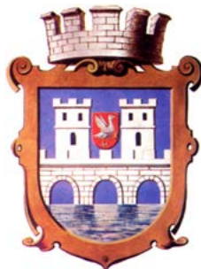
Znak Husovic (z knihy Karel Mrázek: Město Husovice, 1912)

správa nemohla svou funkci dost dobře plnit. Dělnická práce byla velmi namáhavá a finančně podhodnocená, nově přistěhovalí navíc ztratili vazby na své přirozené venkovské křesťanské prostředí. Množily se výstupy z církve spojené právě s továrními dělníky, rostlo nebezpečí sociálních problémů (kriminalita, alkoholismus). „Útočištěm mravní zchátralosti stávaly se zejména Husovice,“ uvede o 40 let poz-