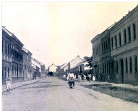
Dnešní Dukelská třída počátkem 20. století

Duchovní správou patřily Husovice pod zábrdovickou farnost. S nárůstem počtu obyvatel zábrdovický kostel svou kapacitou již nestačil a také tamní duchovní