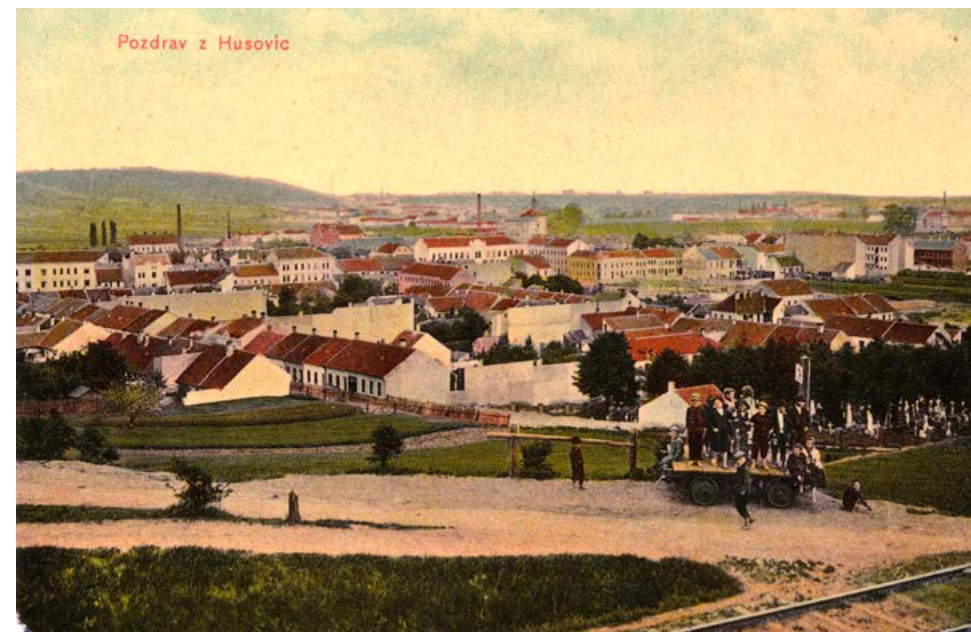
Nově budované centrum Husovic ještě bez dominanty kostela, již však s novostavbou základní školy. Vpravo lze rozeznat staveniště budoucího chrámu. Záběr z roku 1907 je pořízen z místa u bývalé železniční tratě „Tišnovky“ nad zrušeným husovickým hřbitovem (dnes park Marie Restituty)

peněz na stavby kostelů. Neúnavně například psával do časopisů, rozesílal žádosti a prosby jak na jednotlivce, tak i na spolky. Celkem prý poslal 1751 dopisů; v jednom z nich uvádí: „...Neboť v Husovicích není kostela. Ký div, že se lid, jehož valem přibývá, čím dál více odcizuje službám Božím a životu nábožensky a mravně spořádanému a že mezi ním povážlivě se vzmáhají