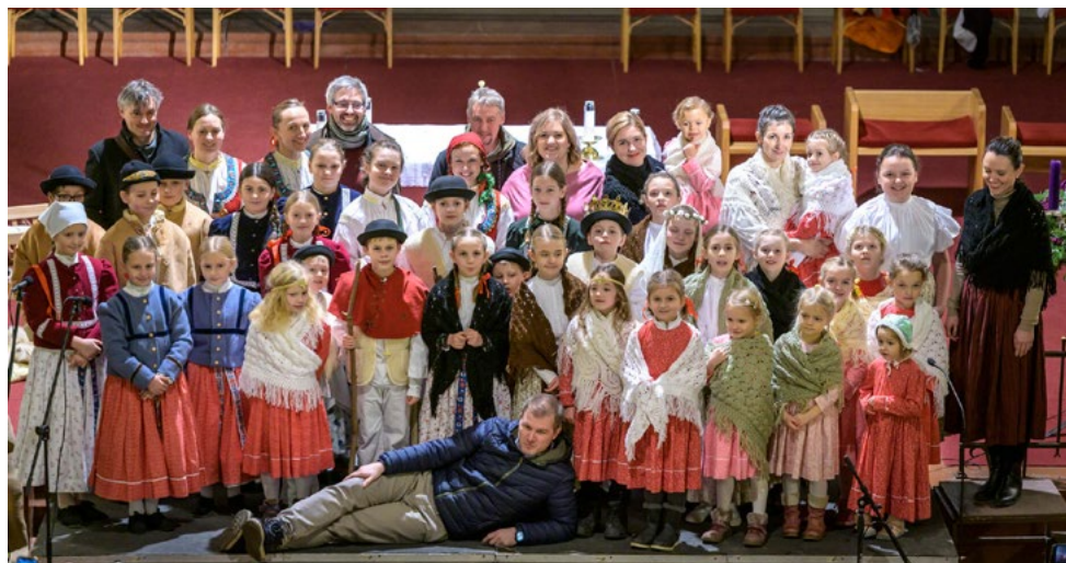
Benefiční vánoční koncert