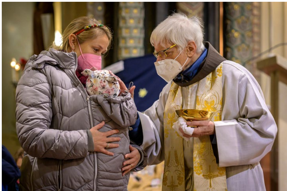
Mše svatá na Štědrý den