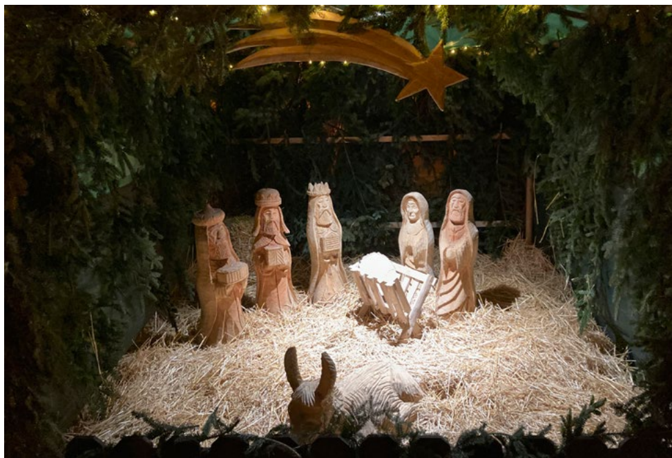
Fotografie Ondřej Špetík