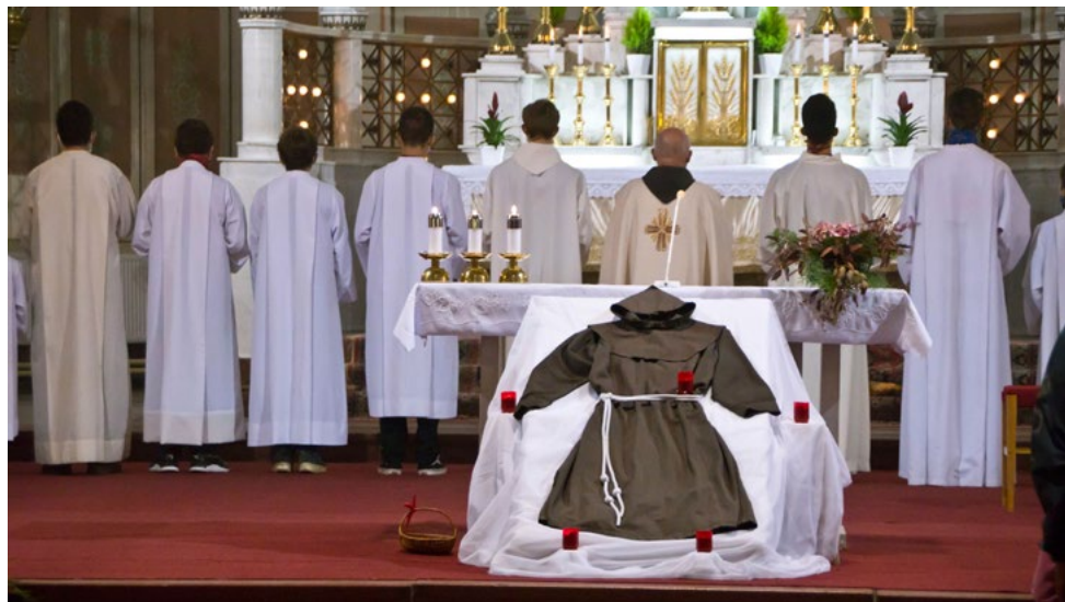
Fotografie Miroslav Boudný