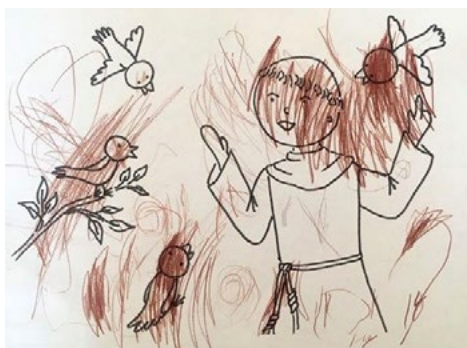
Obrázek vymalovaný dvouletou Ester Štorkovou

Pozoruhodné ale je, že tohle nebylo pouhé sledování obrazovky. Díky různým soutěžním otázkám a domácím úkolům měly děti o čem přemýšlet i mimo vysílání. Během následného losování „výherců“