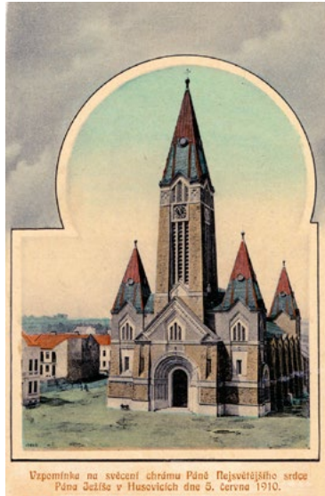
Vzpomínka na svěcení chrámu Páně Nejsvětějšího srdce Páně Ježíše v Husovicích dne 5. června 1910.

Poněvadž kámen určený ke stavbě kostela musel býti všecek dán do základů, a na stavbu bylo třeba zakoupiti materiál další, byl stavební rozpočet překročen