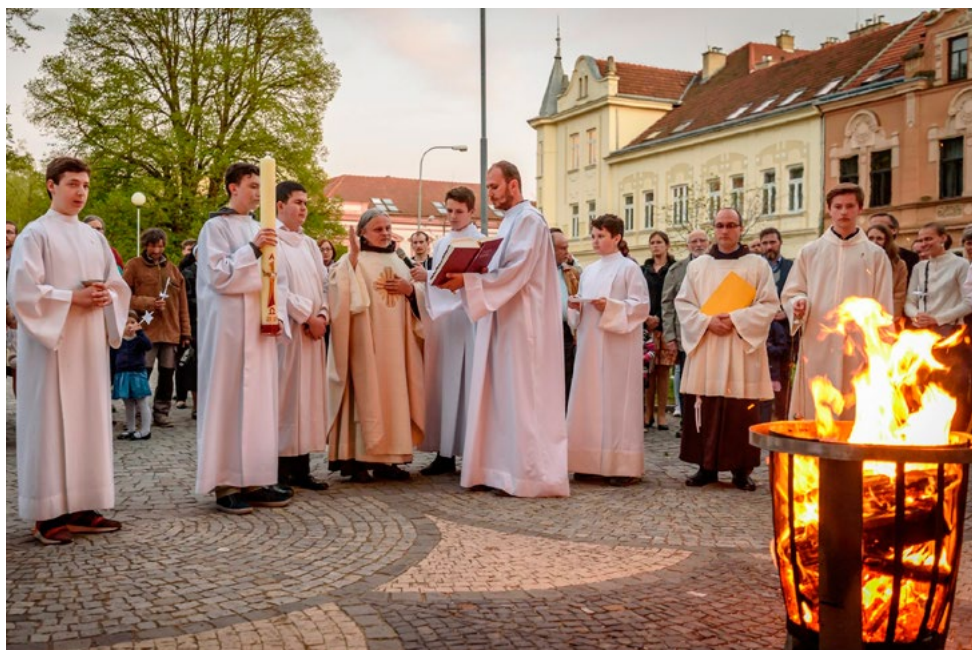
Vigilie spojená s křtem a biřmováním