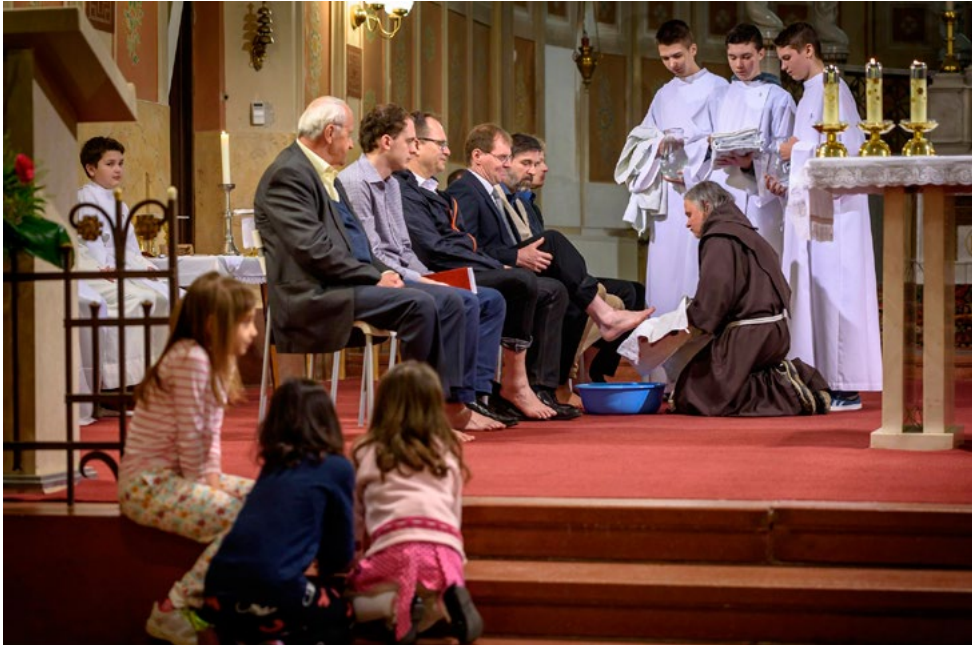
Mše svatá na památku Večere Páně