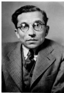
Z básnické skladby Jana Zahradníčka Znamení moci (1950–1951)