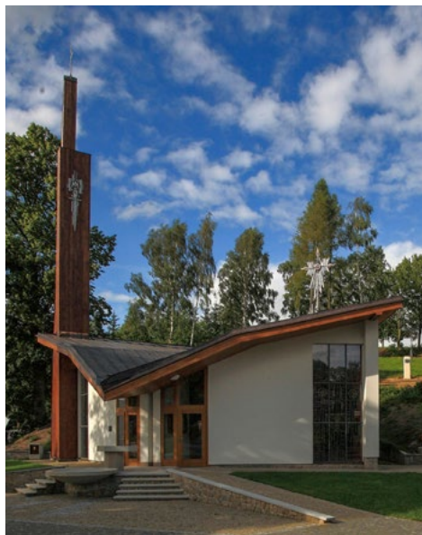
Poutní kostel Božího milosrdenství a svaté Faustiny

Letos uplynulo 10 let od vysvěcení Poutního kostela Božího milosrdenství a sv. Faustiny ve Slavkovicích. Protože se jedná o jeden z nejznámějších kostelů postavených u nás po pádu komunismu, jehož význam již dávno přesáhl hranice Slavkovic a jejich okolí, rádi bychom čtenáře Srdíčka stručně seznámili s historií a současností tohoto poutního místa i obce, v níž se nachází.