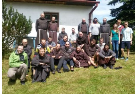
Školské sestry sv. Františka a bratři františkáni před chalupou ve Slavkovicích, v níž žil filmový malý Bobeš a jeho rodina