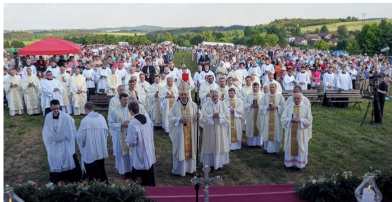
Areál nad kostelem během mše svaté v rámci Národního kongresu o Božím milosrdenství

Na druhou stranu, když jsme ve Staré Boleslavi začali vydávat časopis Apoštol , stál jsem jednou před mapou České republiky a říkal jsem si, že v České republice není poutní místo Božího milosrdenství (zaměření Apoštola je spojeno právě s úctou k Božím milosrdenství). A uvažoval jsem, kde by mohlo jednou být a tipoval jsem poblíž Jihlavy, zhruba uprostřed republiky. A jak vidíte, do Jihlavy to tady opravdu nemáme daleko. Když prohlížím fotografie z desetileté historie tohoto poutního kostela, kolik lidí sem přišlo, tak mám pocit, že se tady něco děje, že to Pán Bůh režíruje.