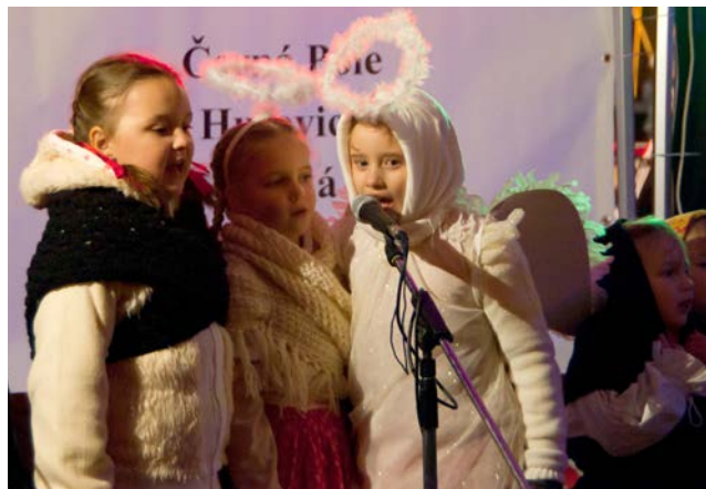
Rozsvěcování vánočního stromu