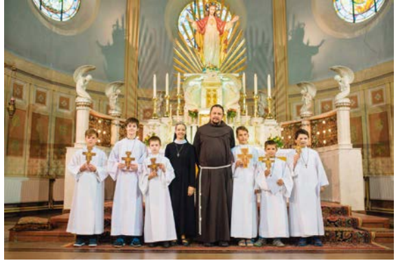
První svaté přijímání