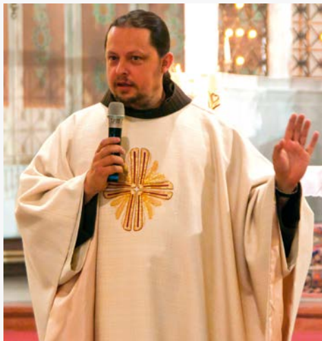
Křtiny na Bílou sobotu (2016)

Čím jsem obohatil farnost, necháme posoudit někoho jiného. Jsem rád, že jsem mohl být k užítku. Radost mám především za to, že jste se jako farnost našli a že