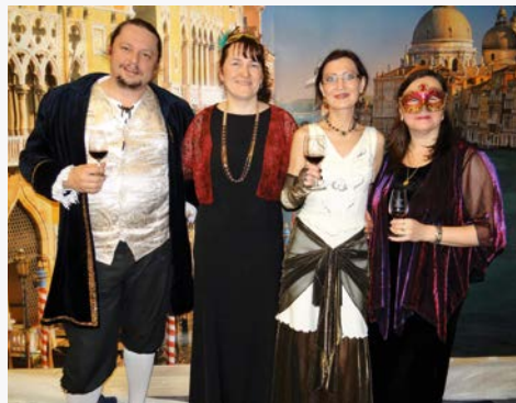
Farní ples (2017)

Pokud bych to směl přirovnat, tak je právě ráno po snídani. Probuzená a připravená. Mám prosbu: neusínajte!