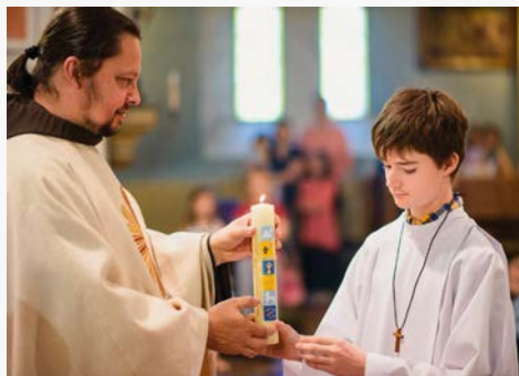
První svatě přijímání (2017)

ovečkám přinutil mnohé z nás přemýšlet o svém životě. Přeji mu, aby šel životem svobodný, plný vnitřního pokoje, aby radost a naděje jej stále obklopovaly a Bůh byl s ním.