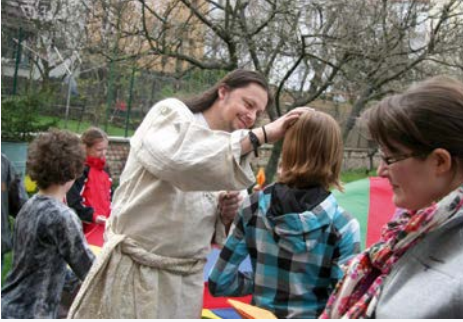
Studánky na faře (2013)