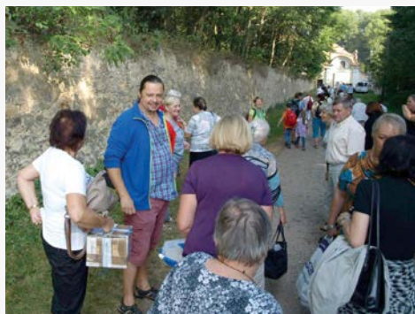
Pouť do Hájků (2016)