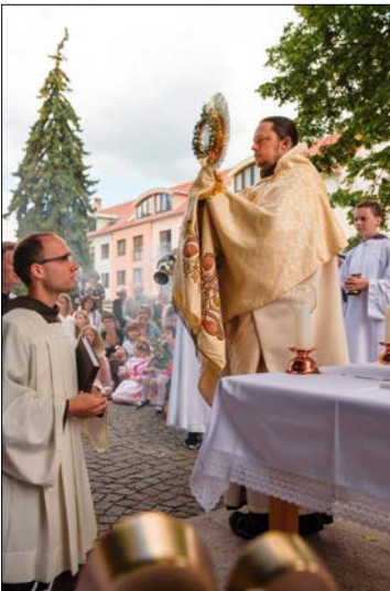
Slavnost těla a krve Páně s průvodem Božího těla