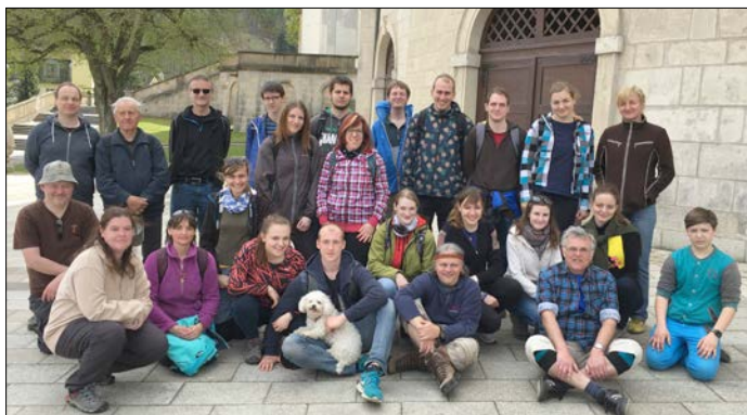
Fotografie pěších poutníků letošní farní pouti

Vyprávění Vladimíra Letochy zapsala Veronika Čermáková.