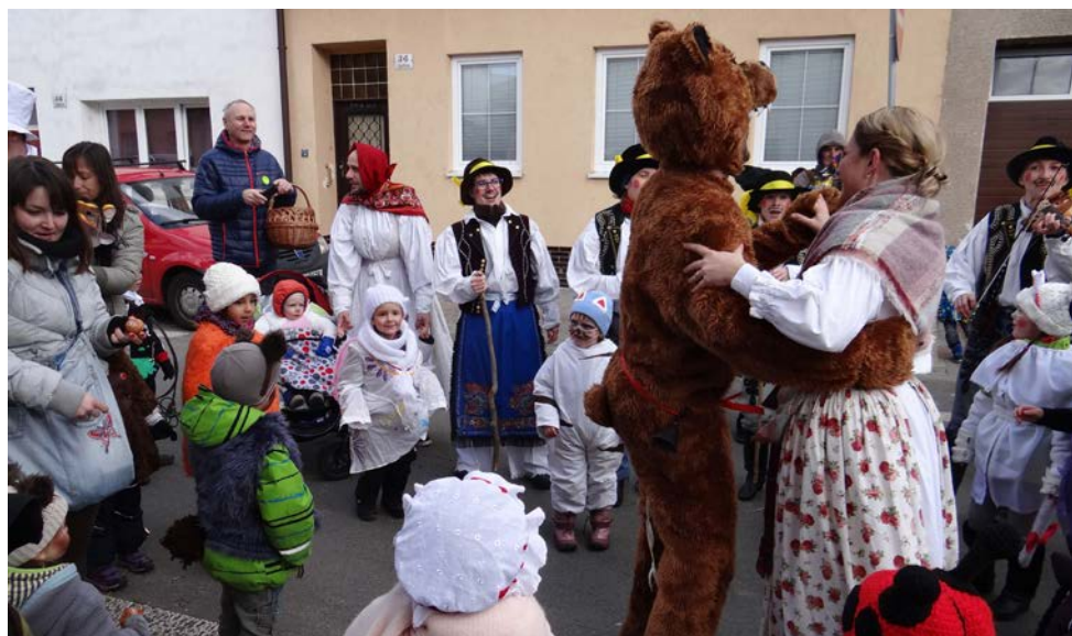
Poslední masopustní sobotu 25. února 2017 prošel Husovicemi fašankový průvod s maskami.