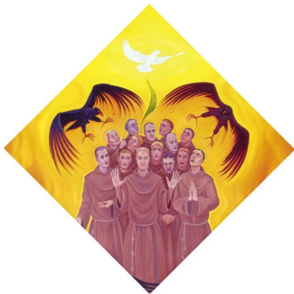
Beatifikační obraz od Tomáše Císařovského

Být zrnem ukrytým v brázdě, aby umíraje každému sobectví, doznělo v klasy plné života.