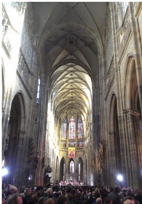
Katedrála sv. Víta v Praze, sobota 13. 10. 2012

Zabití čtrnácti mučedníků kontrastuje ostře s jejich dobrým životem – modlí se a pracují. Zaujímají postoje bratrství,