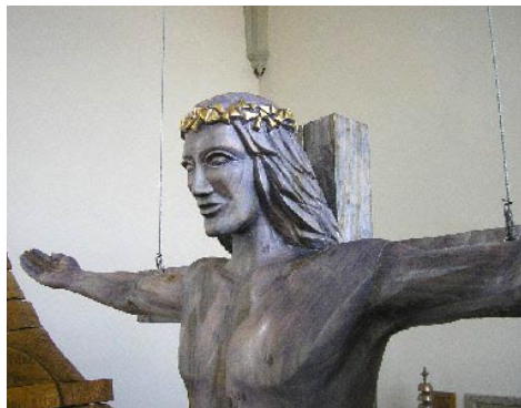
Vladimír Matoušek: Vzkříšený ukřižovaný Kostel Brno-Komárov