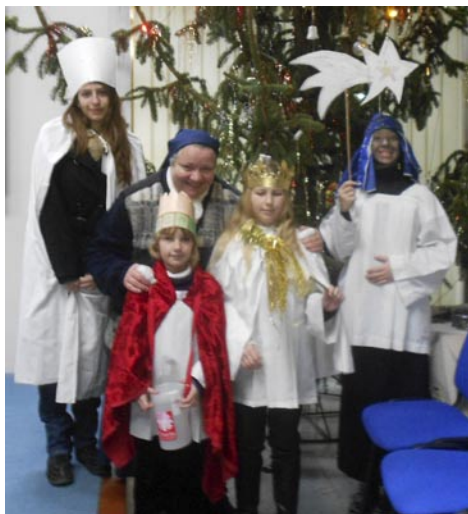
Připravila S. Margita Grobarčíková DKL, past. asistentka

Poděkování patří také těm, kteří přispěli svým finančním prostředkem na dobrou věc, která pomůže mnoha lidem v nouzi nebo k překonání obtíží jejich postižení.