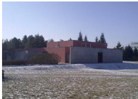
Stavba kostela na Lesné je plánována v sousedství Duchovního centra, které zde stojí od roku 2004.

Pak mě napadlo dát mu, pokud nějaké máme, rovnou dolary z naší sbírky valut. V r. 2006 jsme totiž zahájili sbírku zrušených peněz. Původně to bylo ze zemí, které mají euro, ale lidé nám posílají vše možné,