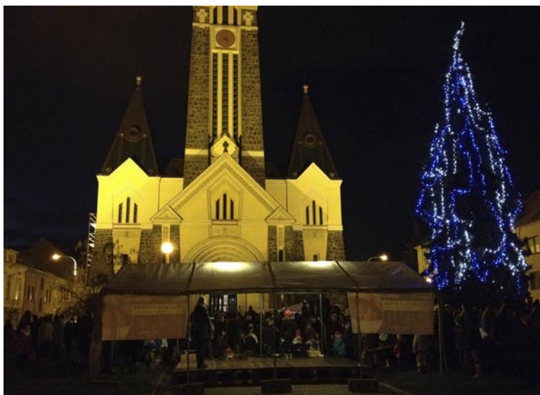
Rozsvícení vánočního stromu před husovickým kostelem o první neděli adventní 2013