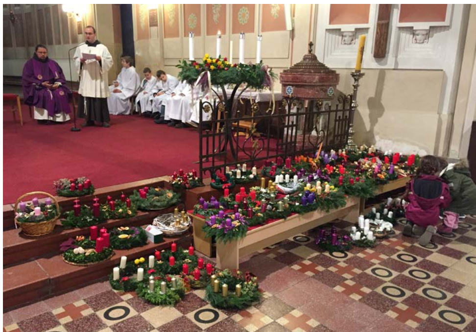
Svěcení adventních věnců na 1. neděli adventní