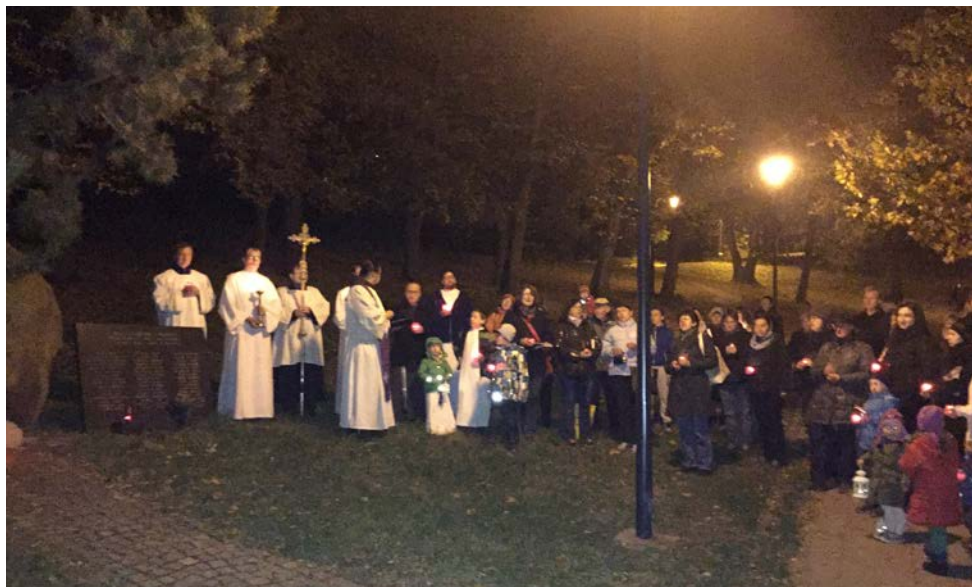
Modlitba za zemřelé na bývalém husovickém hřbitově v den Památky zesnulých