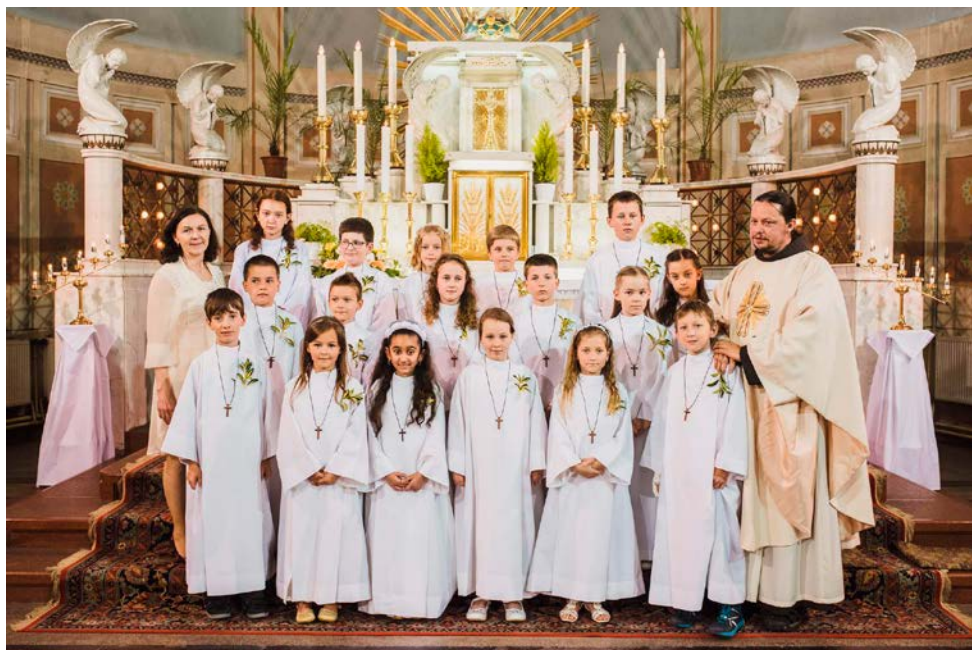
V neděli 5. 6. 2016 poprvé přistoupilo ke svatému přijímání 17 dětí z naší farnosti