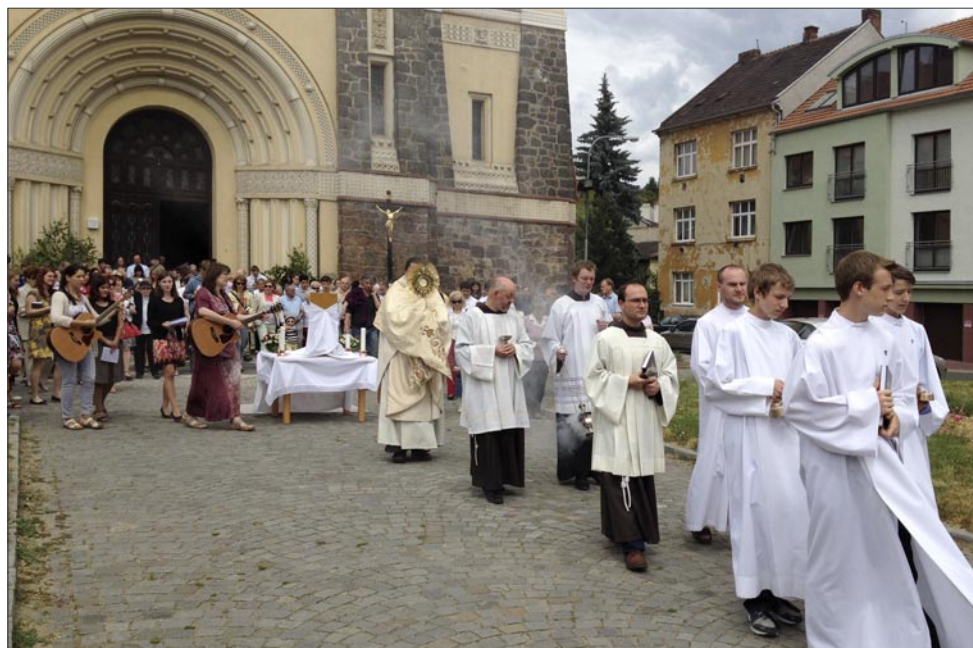
Průvod Božího těla v Husovicích, 22. 6. 2014