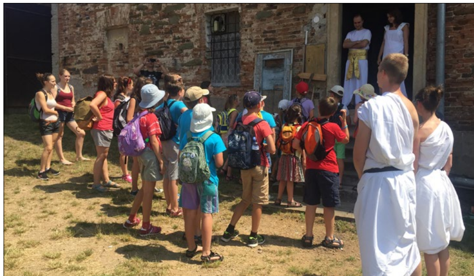
Zahájení farního tábora v Černé Hoře