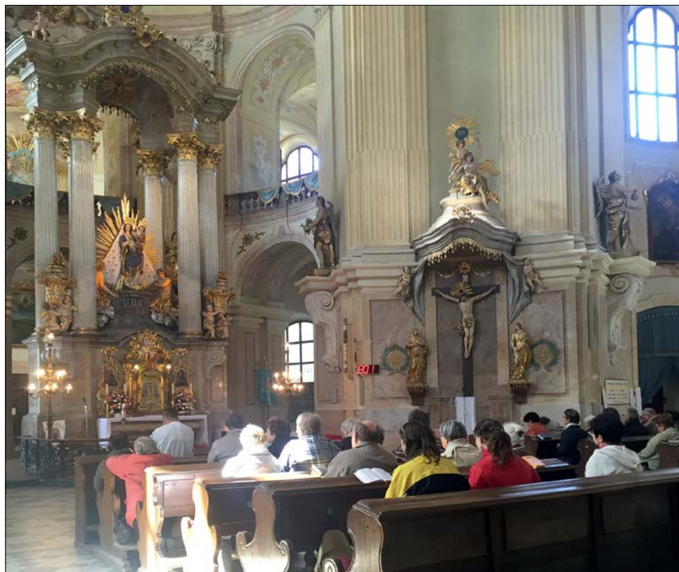
Husovičtí farníci ve křtinském poutním chrámu.