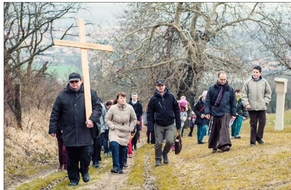
Křížová cesta husovické farnosti na Květnou neděli 20. 3. 2016 ve Slavkově u Brna.