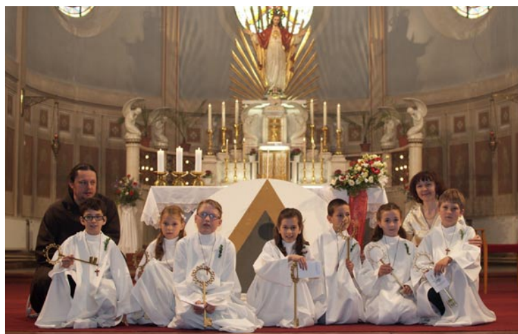
Děti, které letos přistoupily k 1. sv. přijímání