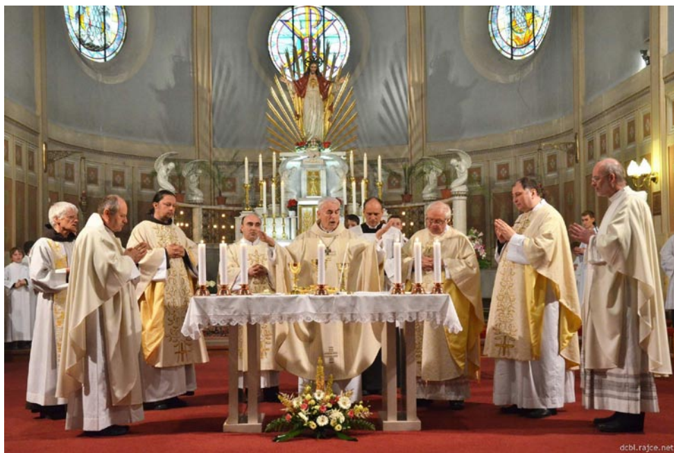
Husovický kostel 4. 5. 2014