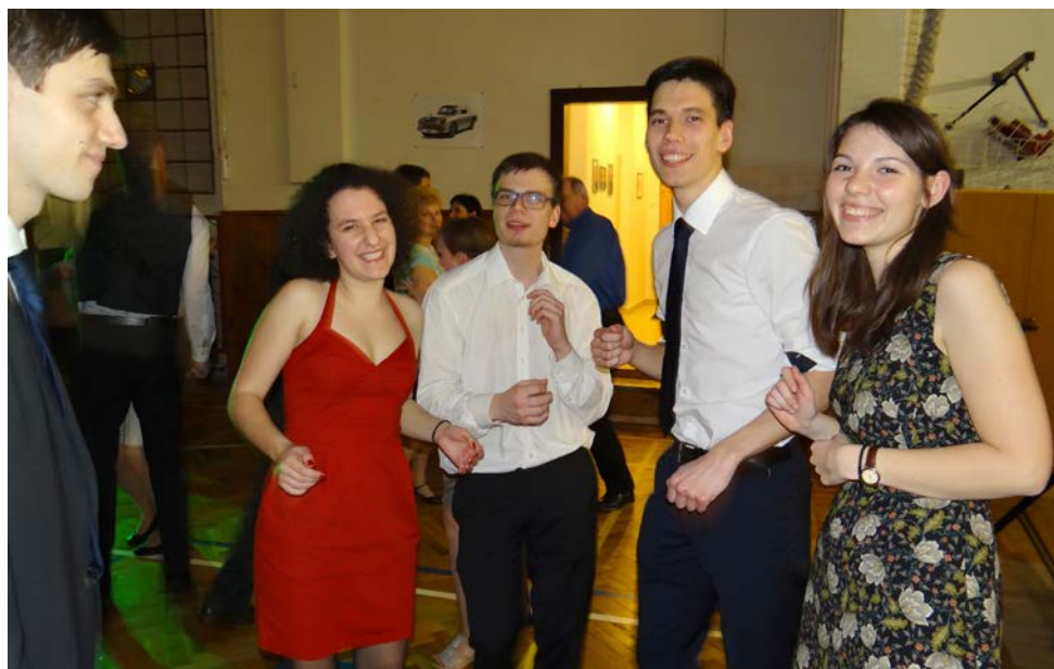
Z plesu farnosti, 6. 2. 2016