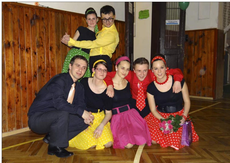
Rebelové v husovické orlovně