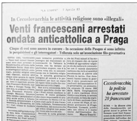
Italský dobový tisk informuje o zatčení františkánů.