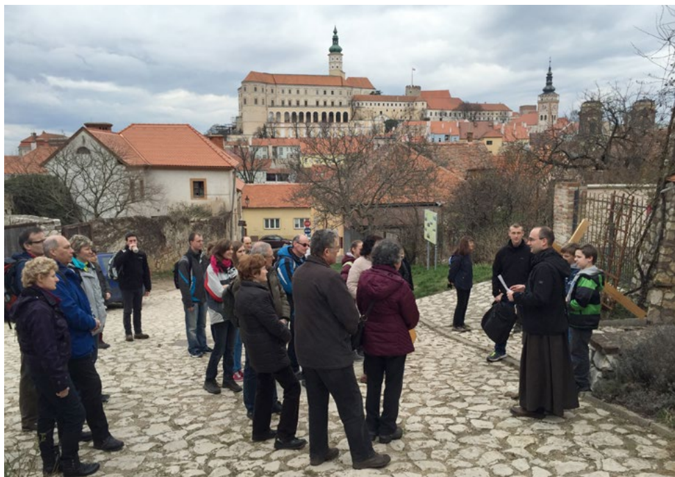
Křížová cesta farnosti v Mikulově na Svatém kopečku 29. 3. 2015

Přihlašování přes internet bude ukončeno 22. června 2015 ve 12.00 hodin.